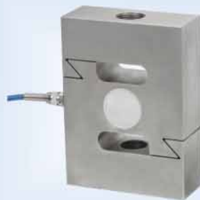
TSG S型 Protection sensor