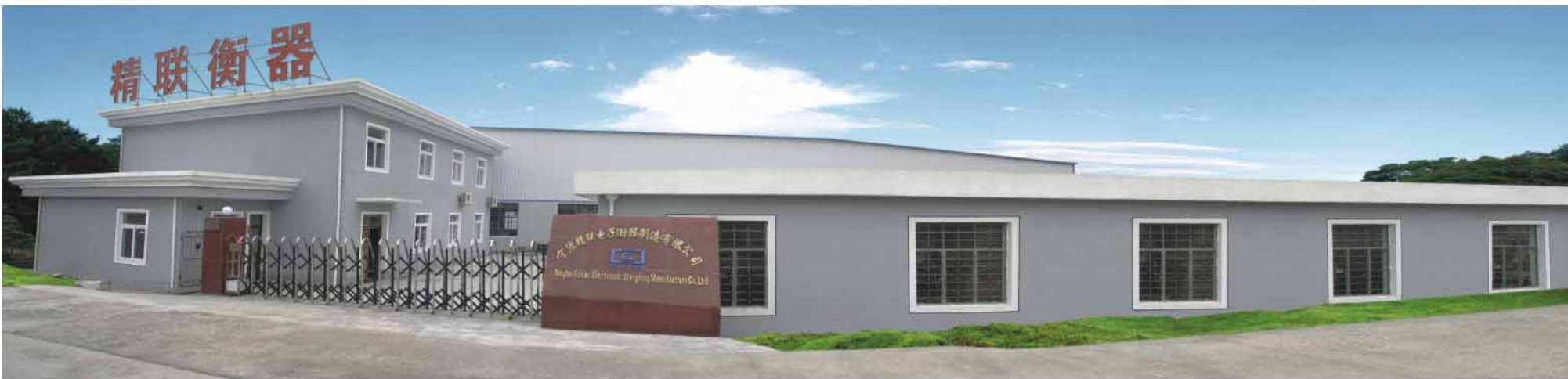
厂房外景 a tour outside our factory

宁波精联电子衡器制造有限公司是一家集科研、开发、制造及经营工业、商业衡器的专业化公司。公司主要开发制造 SCS系列全电子汽车衡、GL系列电子台秤、GL系列平台秤、GL系列电子吊钩秤、GL系列配料系统、称重管理软件系统和机械秤电子化改造。