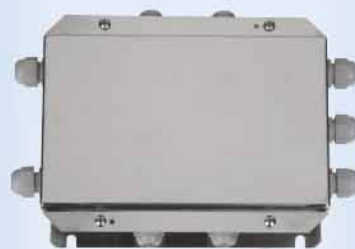
接线盒 GL junction box