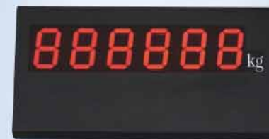
大屏幕 Big screen