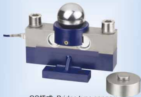
QS桥式 Bridge type sensor