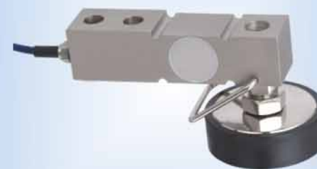
SQC悬臂梁式 Cantilever sensor